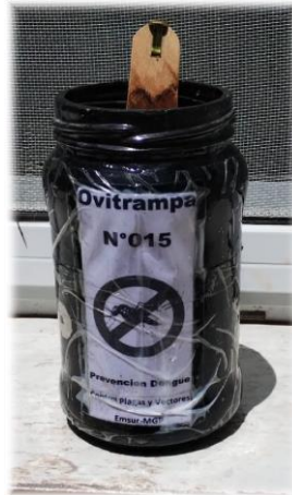
Figura 3. Muestra de ovitrampa utilizada en el muestreo.

Las ovitrampas consisten en un frasco de vidrio pintado de color negro que contiene agua limpia en su interior y un trozo de madera, tipo bajalengua, con borde rugoso fijado con un clip grande para sujetar el mismo (Figura 3). El diseño está basado en la necesidad biológica de las hembras grávidas de los mosquitos de procurar un espacio húmedo para la ovipostura, y buscando una superficie rugosa, como la madera, para la adherencia de los huevos (Figura 2). Cada ovitrampa se encuentra debidamente rotulada numéricamente.